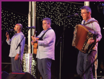
Grup Peix Fregit.